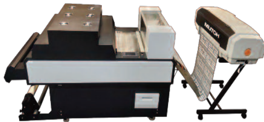
KOLEJNA NOWOŚĆ W OFERCIE TO SYSTEM DTF MUTOH 628 PRZEZNACZONY DO DRUKU NA KOSZULKACH

cyjnych. Ponadto nowe plotery Mutoh charakteryzują się automatyczną kalibracją przesuwu materiału (Feed Master) oraz funkcją Media Tracker, umożliwiającą automatyczne sprawdzenie, ile materiału pozostało na rolce. Dedykowane ekologiczne atramenty posiadają certyfikat GREENGUARD Gold, zaś zastosowane w ploterach adaptory z wymiennymi ekonomicznymi i degazowanymi wkładkami workowymi zmniejszają cenę jednostkową za atrament.