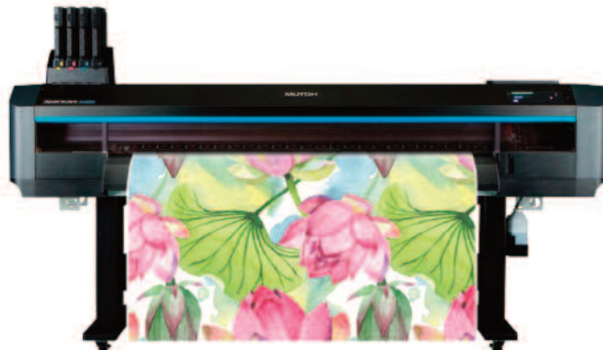
JEDEN Z PLOTERÓW SUBLIMACYJNYCH MUTOH – XPERTJET 1642WR

Firma Mutoh produkuje zarówno plotery LED-UV typu flat-bed – do materiałów sztywnych, jak i rolowe – do materiałów giętkich. Dzięki tym profesjonalnym urządzeniom możliwy jest druk szerokiego spektrum aplikacji: klasycznych grafik (reklamy, szyldy, opakowania, grafiki targowe, wyposażenie sklepów, dekoracje), druk grafik lentykularnych, a także zadrukowywanie nośników o nieregularnym kształcie, ciężkich materiałów, mediów „egzotycznych”, w tym szkła, kamienia, różnych metali, płyt meblowych.