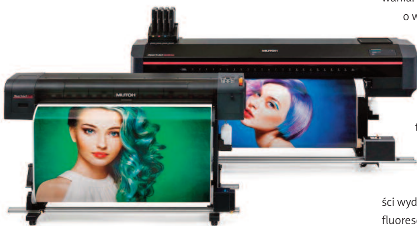
MUTOH WPROWADZA NA RYNEK DWA URZĄDZENIA DO DRUKU ATRAMENTAMI EKO ORAZ ŻYWICZNYMI; BĘDĄ TO MODELE 1341SR PRO I 1641SR PRO

Poza tym nowe plotery są wyposażone w profesjonalne i co najważniejsze, bardzo łatwe w obsłudze oprogramowanie RIP MUTOH VerteLith. W połączeniu z nową, opatentowaną technologią I-screen weaving (druk bez paskowania) nowe głowice piezo zapewniają wyjątkową jakość druku także przy wyższych prędkościach produk-