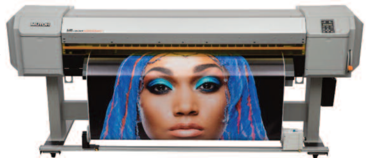
PLOTER ROLOWY UV/LED MUTOH 1638UR2

Mutoh produkuje zarówno plotery LED-UV typu flatbed, jak i rolowe, dzięki tym urządzeniom możliwy jest druk szerokiego spektrum aplikacji. Produkty Mutoh są produkowane zgodnie z najsurowszymi wytycznymi UE w zakresie ochrony środowiska, bezpieczeństwa i higieny pracy dla właścicieli oraz operatorów maszyn