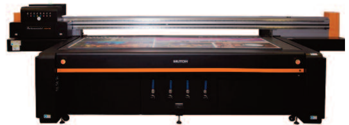
PLOTER LED-UV TYPU FLATBED MUTOH PJ-2508UF