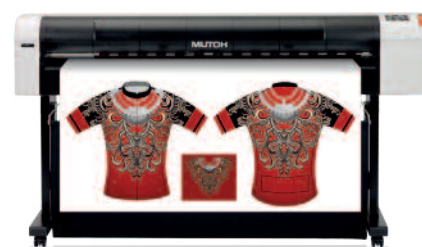
Mutoh RJ-900 XG 1.07 m