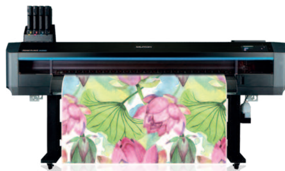
Mutoh XpertJet 1642WR 1.6 m

Opracowano na podstawie materiałów firmy Atrium