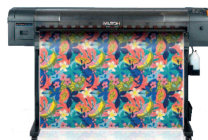
Mutoh XpertJet 1341WR Pro 1.3 m