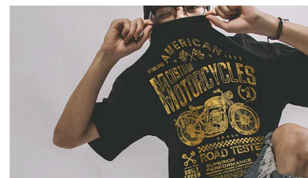
Nieliczone możliwości personalizacji - nadruków na koszulkach