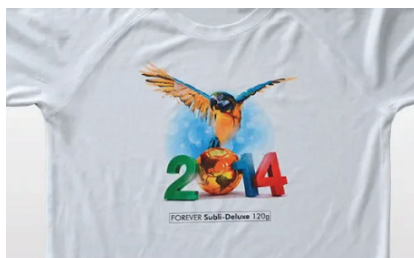
Nadruki czarno-białe oraz kolorowe